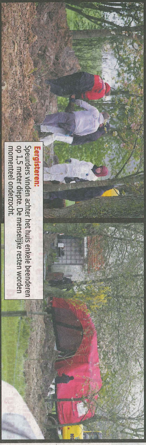
Eergisteren: Speurders vinden achter het huis enkele beenderen op 1,5 meter diepte. De menselijke resten worden momenteel onderzocht.

Speurders ontdekken tweede skelet in amper twee dagen tijd